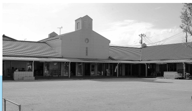
認定こども園になった際に場所を 移転して新築した園舎